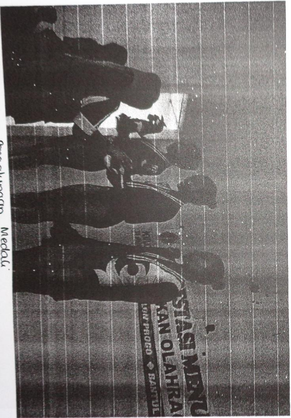
Pengalungan Medali % Sindy Rur Lalla A.A